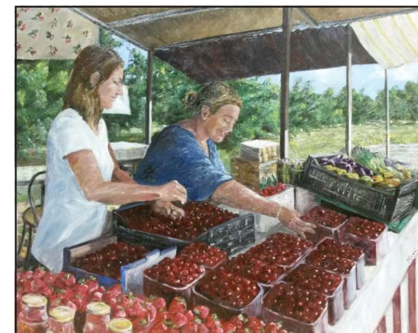
"Tempo di ciliegie"