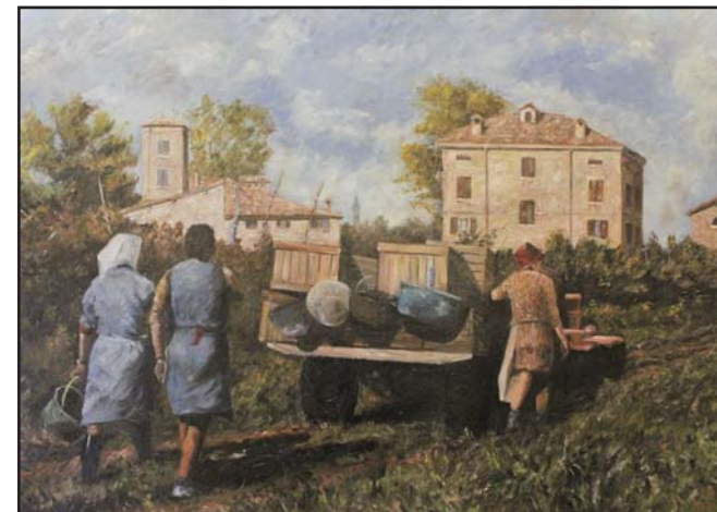
"Vendemmia a San Polo" olio su tela cm. 71x100