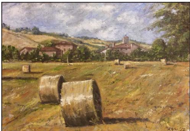
"Rotoballe a San Polo" olio su Juta cm. 50x70