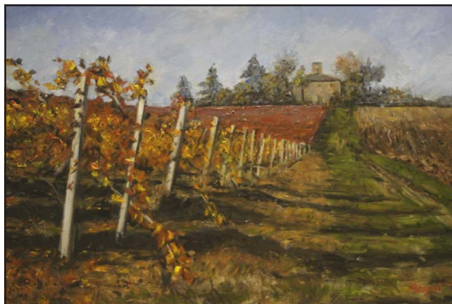
"Vigneti a Castelvetro" olio su tela cm. 45x60