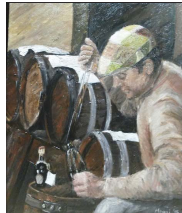
"Al saz" olio su tela cm. 50x60